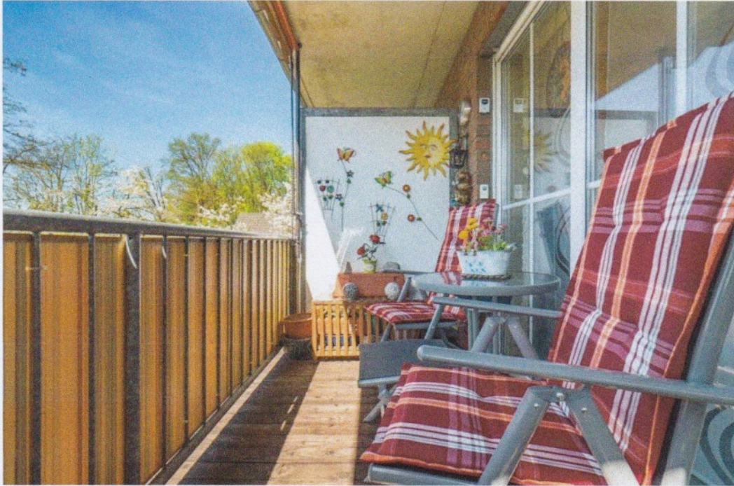
Wohnung in Wesel