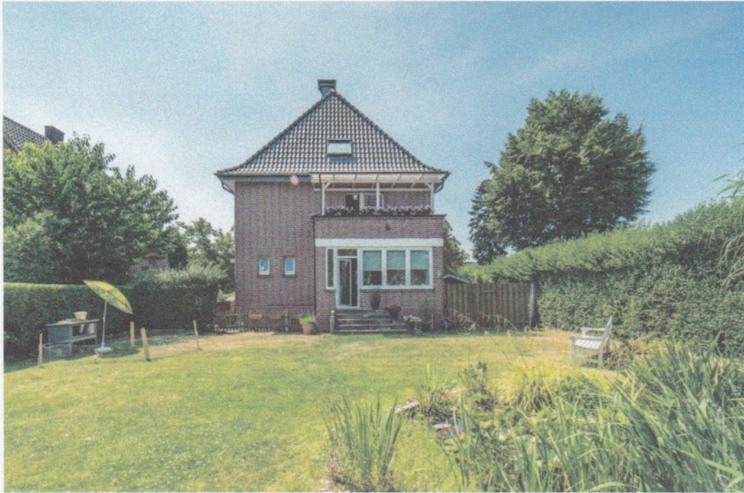
Haus in Wesel