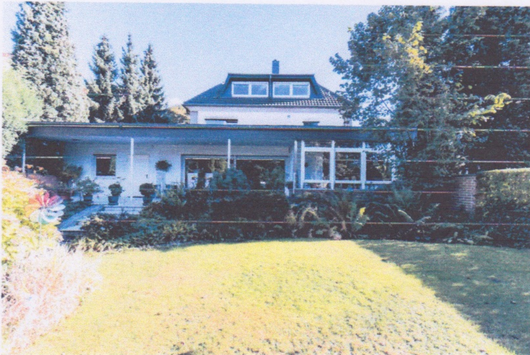
Einfamilienhaus in 46562 Voerde-Friedrichsfeld